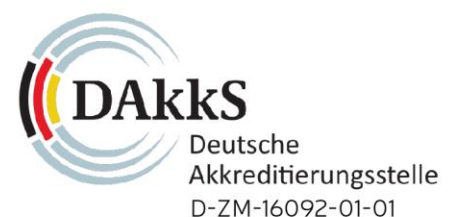
Zertifizierungsstelle Ulrich Schmidt